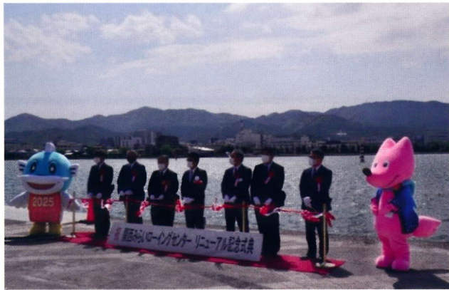
(テープカットの様子)

愛称が「関西みらいローイングセンター」となり、真新しい会議室、トレーニング室、エレベーターを備えた管理棟、審判塔など、今までなかった施設で、気持ちよく大会をしていただいたり、2階のデッキで観覧していただいたりと、皆様に今まで以上に活用していただけたらと思っております。