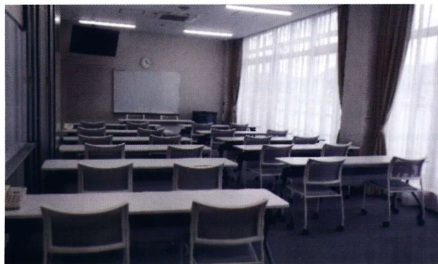
2階 会議室兼宿泊室 (パーティションで区切り、1/2利用可)