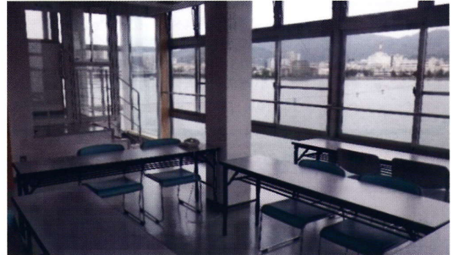
審判塔 審判室 (会議や研修にも使用できます。)