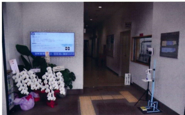
(玄関、受付カウンター)